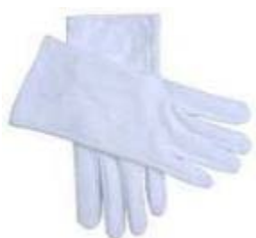
GUANTES BLANCOS $ 1.368